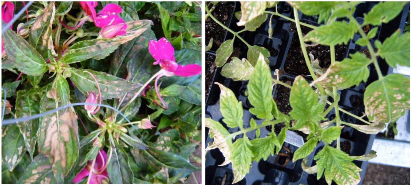
Rajah 3. Gejala ketoksikan ammonium di New Guinea impatiens dan tomato.

Keadaan tertentu seperti suhu rendah (kurang daripada 60°F purata suhu harian), media tumbuh tepu air atau oksigen rendah, dan pH sederhana rendah akan menyekat fungsi bakteria nitrifikasi dan menyebabkan ammonium terkumpul sehingga paras toksik dalam medium tumbuh. Gejala ketoksikan ammonium termasuk keriting ke atas atau ke bawah daun bawah bergantung kepada spesies tumbuhan; dan kekuningan di antara urat daun tua yang boleh berkembang kepada kematian sel (Rajah 3).